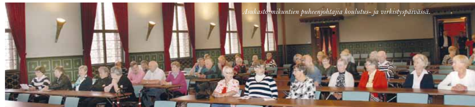
Asukastoimikuntien puheenjohtajia koulutus- ja virkistyspäivässä.

Hän kannustaa jokaista pitämään huolta kanssaihmisistään, sillä viranomaiset eivät voi millään huomata kaikkea avuntarvetta. Yksin asuvan naapurin voi kutsua vaikka kahville tai kävelyille ja vaihtaa samalla kuulumiset. On hyvä muistaa, että sosiaalinen vuorovaikutus on tärkeä osa merkityksellistä elämää.