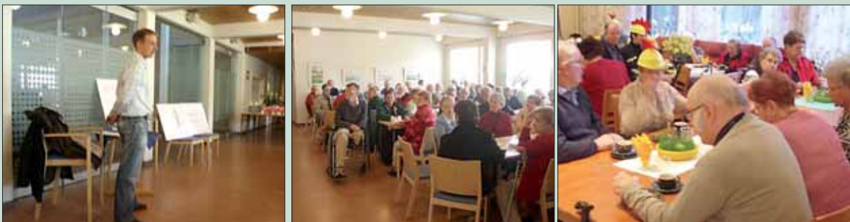
Nekala2 tiedotustilaisuus uudisrakentamisesta (vas. ja kesk.). Takahuhtien yhteiset pääsiäiskarkelot (oik.).