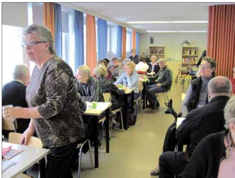
Yhteistoimintaryhmä keskusteli vilkkaasti asukastoiminnasta.

Asukastoimikunta ottaa vastaan, muotoilee ja välittää edelleen aloitteita, joiden tarkoituksena on edistää ja parantaa asumismukavuutta. Toimikunta kokoontuu käsittelemään tietoonsa saatettuja asioita. Asukastoimikunnalla ei ole valtuuksia toimia tuomarina tai poliisina eikä se valvo asukkaita ja hei-