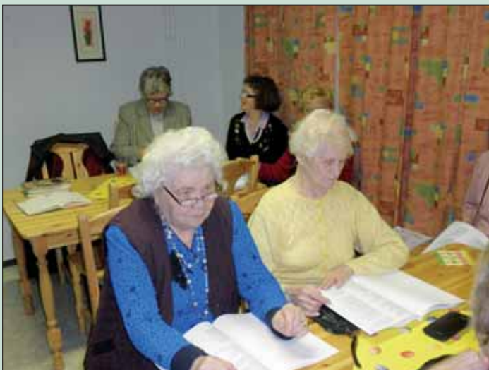
Laulukööri vierailulla Vipusenkatu 5:ssä.