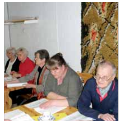
Laulukööri vierailulla Vipusenkatu 5:ssä.

– On kyllä aika tukala tilanne silloin, kun tulee oikein vaikea sävellaji eteen. Mutta aina on niistä selvitty.