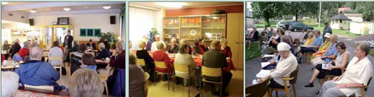
Vammaisasiamies Takahuhti 1:n vieraana (vas.). Uudenkylän joulujuhlat Hakapirtillä (kes.). Lättykestit Raholassa (oik.).